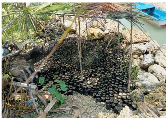
Gambar 6. Penanaman mangrove di dalam polybag dan peletakkan bibit di tempat ternaung

Berdasarkan hasil evaluasi kegiatan pelatihan pembibitan mangrove ( Gambar 7 ), terdapat peningkatan keterampilan peserta dalam beberapa