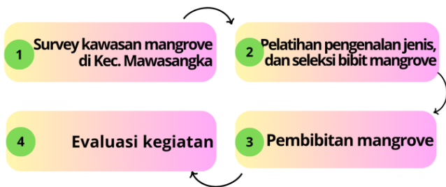
Gambar 1. Tahapan pelaksanaan kegiatan 1. Survey Kawasan Mangrove Kecamatan Mawasangka

Kegiatan ini dilaksanakan pada bulan Oktober tahun 2021 di kawasan tambak Kecamatan Mawasangka. Tambak ini merupakan tambak yang baru dicetak, dan belum sepenuhnya beroperasi. Pelaksanaan kegiatan melibatkan 40 orang mahasiswa dari program studi Ilmu Kelautan, dan Ilmu Perikanan Universitas Sembilanbelas November Kolaka. Selain itu, 2 orang petambak juga ikut terlibat. Metode pelaksanaan kegiatan terbagi menjadi empat tahapan utama yaitu survey kawasan, pelatihan seleksi bibit, pembibitan, dan evaluasi kegiatan yang ditunjukkan pada diagram alir tahapan kegiatan berikut.