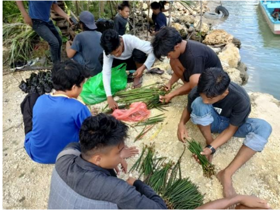
Gambar 5. Seleksi bibit propagul mangrove

Total 1200 bibit mangrove berhasil diseleksi dan dibibitkan, yang terdiri dari enam ratus (600) jenis Ceriops tagal , empat ratus (400) jenis Rhizophora apiculata , seratus jenis Rhizophora mucronata , dan seratus (100) jenis Bruguiera gymnorrhiza . Setelah dilakukan penanaman di dalam polybag, bibit diletakkan di tempat ternaung dan terpengaruhi oleh pasang-surut untuk mencegah bibit terpapar sinar matahari secara langsung, serta membiarkan bibit terpapar air laut. Berikut merupakan gambar penanaman bibit ke dalam polybag dan peletakkan bibit di tempat ternaung.