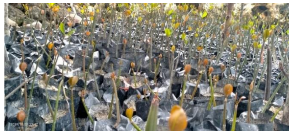
Gambar 8. Evaluasi keberhasilan pembibitan mangrove. Atas (awal); Bawah (30 hari setelah tanam)