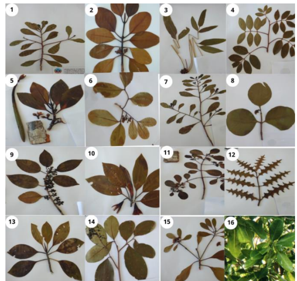
Gambar 4. Jenis-jenis mangrove yang ditemui di lokasi pengabdian

Jenis-jenis mangrove yang dijumpai di lokasi pengabdian terdiri dari tujuh belas (16) jenis, yaitu (1) Lumnitzera littorea , (2) Ceriops decandra , (3) Acrostichum aureum , (4) Xylocarpus moluccensis , (5) Rhizophora apiculata , (6) Xylocarpus granatum , (7) Lumnitzera racemosa , (8) Sonneratia alba , (9) Excoecaria agallocha , (10) Bruguiera gymnorrhiza , (11) Osbornia octodonta , (12) Acanthus ilicifolius , (13) Bruguiera cylindrical , (14) Xylocarpus mekongensis , (15) Ceriops tagal , dan (16) Rhizophora mucronata . Hasil ini jauh lebih banyak dari jenis mangrove yang diperoleh oleh Agusri et al (2015) sebanyak 8 jenis di Wakatobi, dan Hasidu et al (2022) sebanyak 8 jenis di Kolaka. Berikut merupakan dokumentasi jenis-jenis mangrove yang ditemukan di lokasi pengabdian.