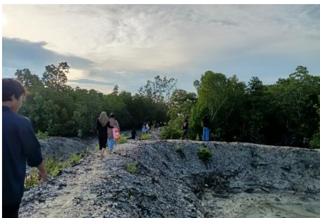
Gambar 3. Kondisi ekosistem mangrove Desa Oengkolaki yang dijadikan sebagai lokasi pengabdian

Jenis-jenis mangrove yang dijumpai di lokasi pengabdian terdiri dari tujuh belas (16) jenis, yaitu (1) Lumnitzera littorea , (2) Ceriops decandra , (3) Acrostichum aureum , (4) Xylocarpus moluccensis , (5) Rhizophora apiculata , (6) Xylocarpus granatum , (7) Lumnitzera racemosa , (8) Sonneratia alba , (9) Excoecaria agallocha , (10) Bruguiera gymnorrhiza , (11) Osbornia octodonta , (12) Acanthus ilicifolius , (13) Bruguiera cylindrical , (14) Xylocarpus mekongensis , (15) Ceriops tagal , dan (16) Rhizophora mucronata . Hasil ini jauh lebih banyak dari jenis mangrove yang diperoleh oleh Agusri et al (2015) sebanyak 8 jenis di Wakatobi, dan Hasidu et al (2022) sebanyak 8 jenis di Kolaka. Berikut merupakan dokumentasi jenis-jenis mangrove yang ditemukan di lokasi pengabdian.