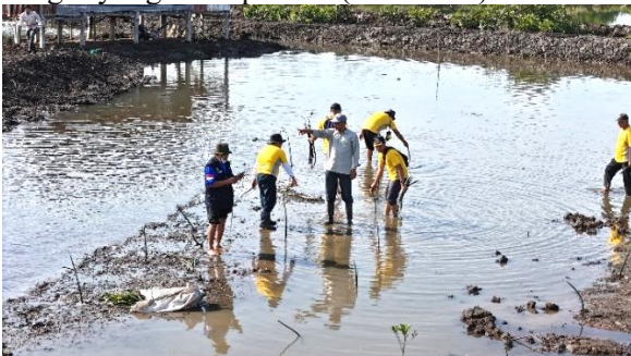
Gambar 3. Kegiatan penanaman bibit mangrove

Berikut ini merupakan dokumentasi kegiatan menunjukkan suasana kolaboratif dan semangat gotong royong antar peserta (Gambar 3).