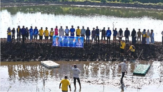
Gambar 2. Foto bersama peserta kegiatan

Kegiatan dihadiri oleh sekitar 80 peserta dari berbagai unsur, termasuk Dosen Politeknik Kelautan dan Perikanan Bone, YL Forest, Cabang Dinas Kelautan Bosowasi, Penyuluh Perikanan Kabupaten Bone, serta masyarakat lokal Desa Pattiro Sompe. Berikut merupakan dokumentasi para peserta kegiatan (Gambar 2).