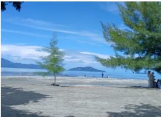
Gambar 5. Kondisi Setelah Kegiatan Pengabdian

Peran wisatawan dalam kegiatan pembersihan dapat memberikan pemahaman akan pentingnya menjaga wisata agar tetap asri dan bersih, serta dapat menambah semangat masyarakat setempat guna menjaga kebersihan dan keindahan kawasan wisata. Masyarakat yang belum teredukasi juga menjadi salah satu faktor penyebab terjadinya pencemaran pantai kapu sebagai tanggung jawab moral (Abrori & Listiani, 2017) untuk membantu menjaga kelestarian lingkungan Kawasan wisata pantai kapu Pengelolaan pantai yang baik dan rutin melakukan pembersihan pantai merupakan salah satu upaya untuk menjaga kebersihan dan kelestarian lingkungan pantai (Septrizarty et al., 2023) Aktifitas masyarakat yang aktif menjadi salah satu upaya untuk menjaga kebersihan Pantai (Simanjorang et al., 2023)