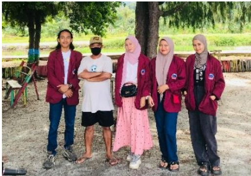
Gambar 2. Observasi Kepada pengelola

Kegiatan pengabdian masyarakat ini dilaksanakan di wisata Pantai Kapu yang berlokasi di Desa Kapu,Kecamatan Samaturu, Kabupaten Kolaka pada tanggal 13-15 April 2024. Kegiatan ini berjalan dengan baik dan sesuai dengan tahapan program yang telah direncanakan.