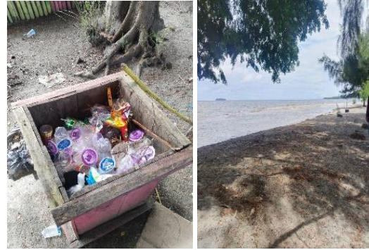
Gambar 1. Kondisi Tempat sampah dan lingkungan wisata

Namun saat ini, Pantai Kapu tercemar dengan banyaknya sampah plastik dan organik yang berserakan dan mengurangi keindahan pantai. Sampah tersebut berasal dari aktivitas wisata, seperti sisa pembungkus makanan, dan juga terbawa oleh ombak dari tempat lain di luar Pantai kapu (Kaharto et al., 2023)