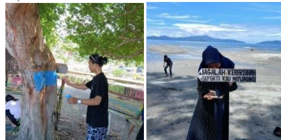
Gambar 4. Proses Pengecatan

Langkah kedua yang tim pengabdian lakukan yaitu Sebelum melakukan aktivitas bersih pantai, tim pengabdian akan diberikan penjelasan awal yang mengenai tata cara pelaksanaan bersih Pantai, termasuk pentingnya kegiatanaksi bersih pantai melaksanakan pembersihan Pantai dengan cara memungut sampah-sampah plastik yang berserakan dan menyapu sampah organik yang berasal dari daun dan ranting pohon cemara yang sudah jatuh. Serta kami melakukan pengecatan beberapa spot foto dan pohon agar lebih menarik. Ternyata pembersihan disekitar wisata pantai tidak mudah(Selviana et al., 2022)